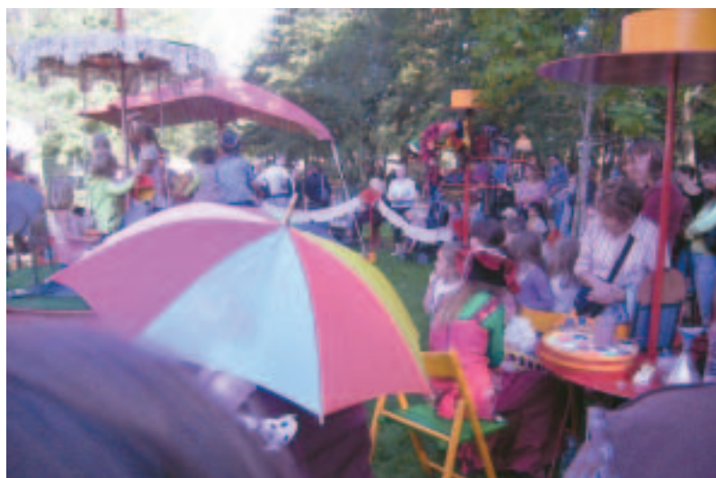
Un choix d'activités pour un large public.

et le comité de jumelage de Mozac. Outre la découverte de la fête, cette rencontre, dans le cadre d'un apéritif offert par la municipalité, a été l'occasion d'échanges entre les différentes personnes présentes avec pour fond musical l'ensemble de Bagolino.