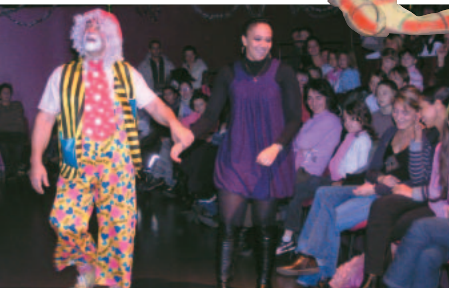
Un spectacle pas seulement pour les petits !

La hotte du Père Noël était remplie de vœux pour tous à l'aube de l'année 2010 !