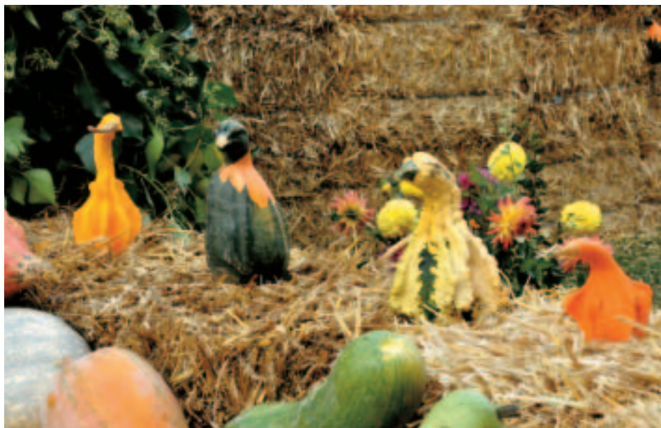
Des sujets inattendus...

L'abondante récolte des potirons, support de la fête, a concrétisé les efforts de chacun depuis les semailles de début mai.