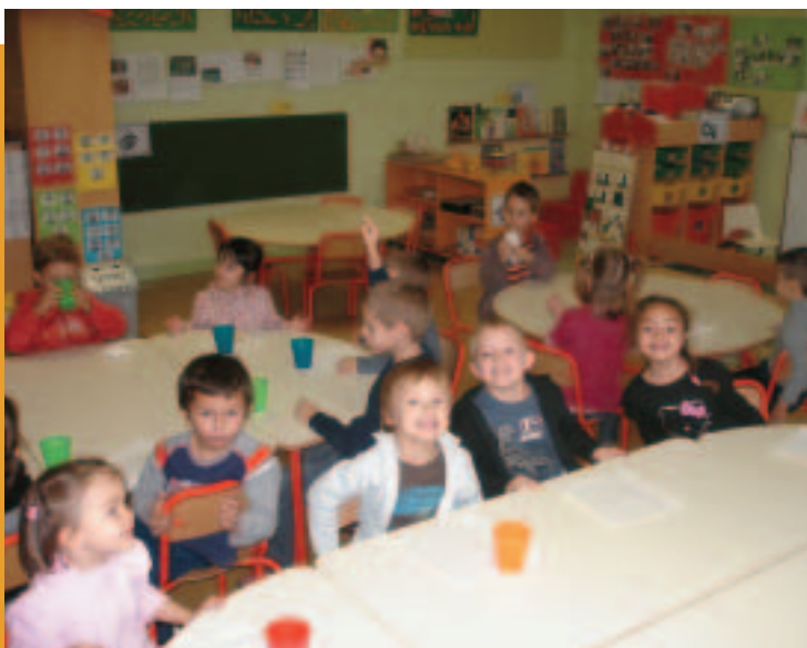
Le mobilier d'une classe maternelle a été renouvelé : un nouvel environnement pour le plaisir et le confort des tout-petits.