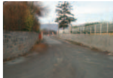
Rue des Pommiers.

L es treize pavillons construits dans le cadre du projet départemental d'habitat adapté destiné à reloger des familles de "gens du voyage" sédentarisés ont maintenant reçu leurs premiers locataires (en attente depuis de nombreuses années), qui ont quitté leur habitat précaire depuis fin novembre. Ce sont maintenant cinquante-sept personnes qui ont intégré les logements qui constituent le lotissement des Rosiers (rue de l'Amor rebaptisée rue des Pommiers) dont la gestion