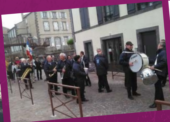
• 8 mai