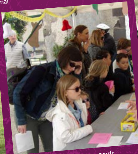
• Chasse aux oeufs