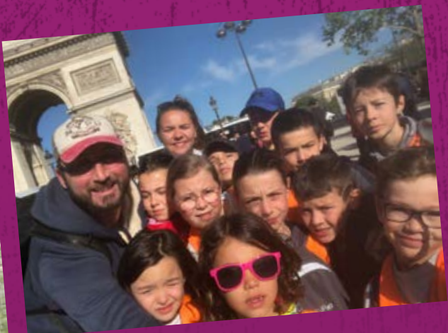
• Centre d'animation