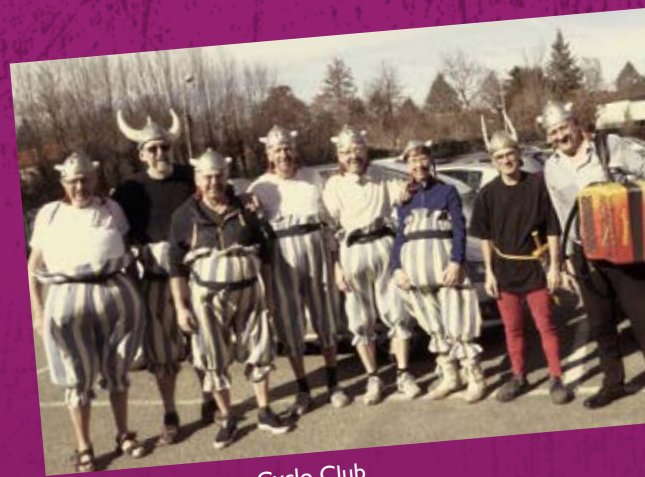
• Carnaval, Mozac Cyclo Club