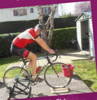
• Mozac Cyclo Club