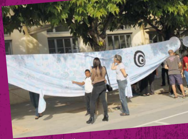
• Ecoles : projet swimmy