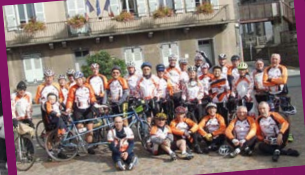
• Mozac cyclo club