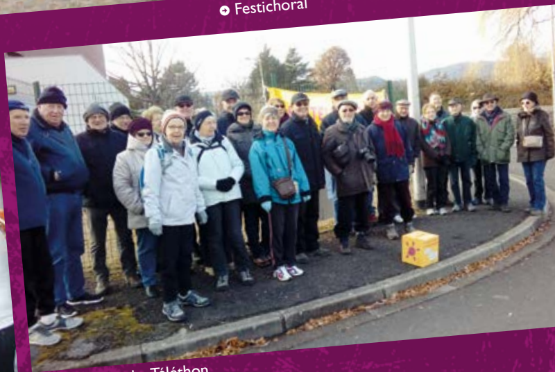
• Marche Téléthon