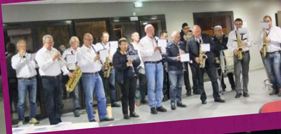
• Harmonie de Mozac