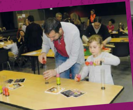
• Ludothèque : fête du jeu