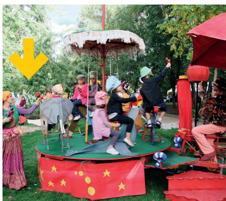
→ le manège offert par la municipalité a ravi les enfants