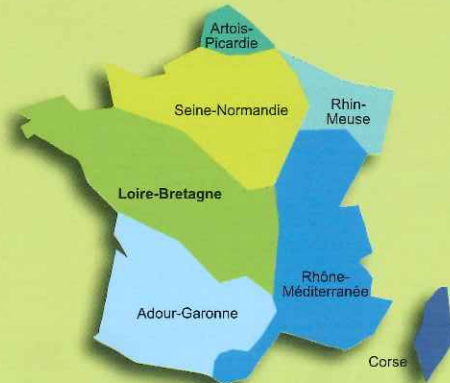
Les 7 bassins hydrographiques métropolitains

Pour reconquérir le bon état des eaux demandé par la directive cadre sur l'eau, les agences de l'eau recherchent la meilleure efficacité environnementale,