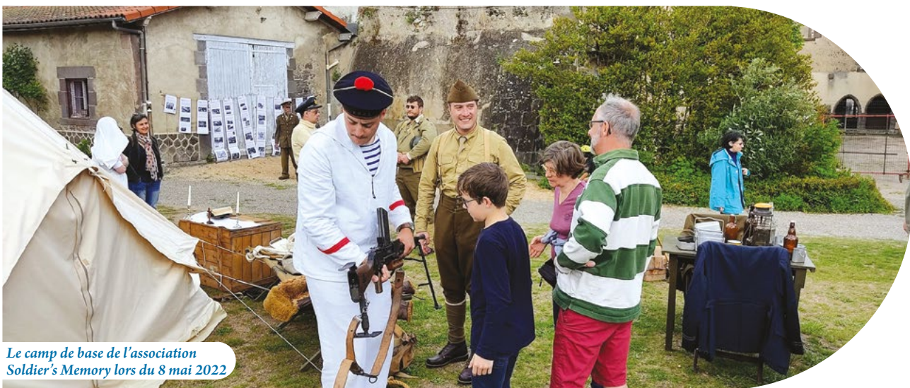
Le camp de base de l'association Soldier's Memory lors du 8 mai 2022