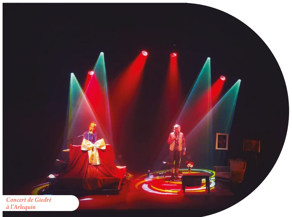
Concert de Giedré à L'Arlequin