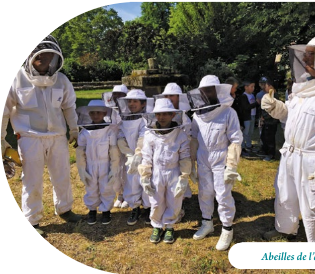
Abeilles de l'abbaye de Mozac