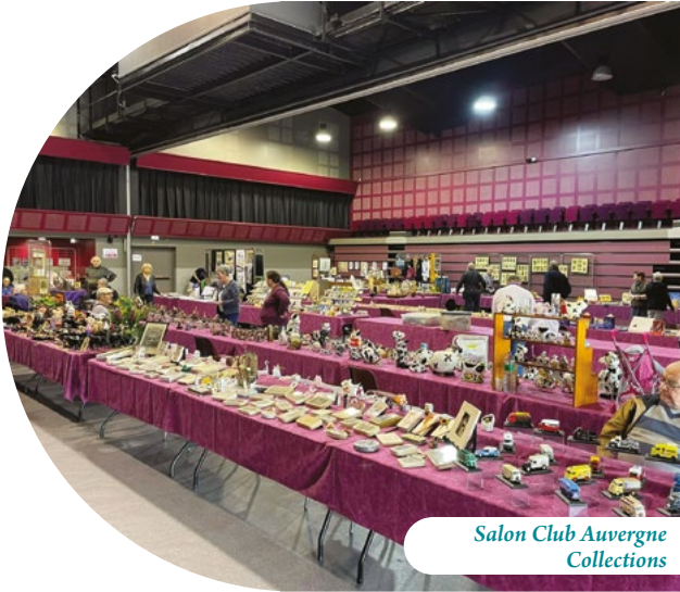
Salon Club Auvergne Collections