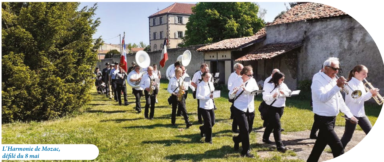
L'Harmonie de Mozac, défilé du 8 mai