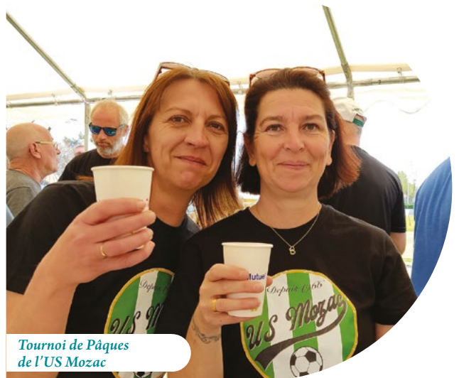
Tournoi de Pâques de l'US Mozac