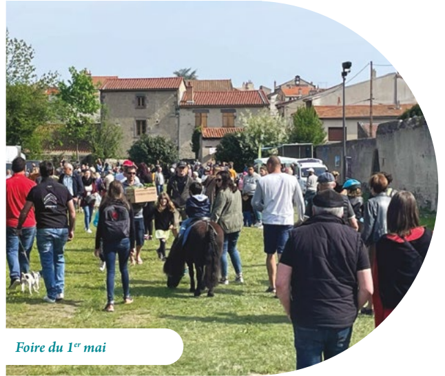
Foire du 1 er mai