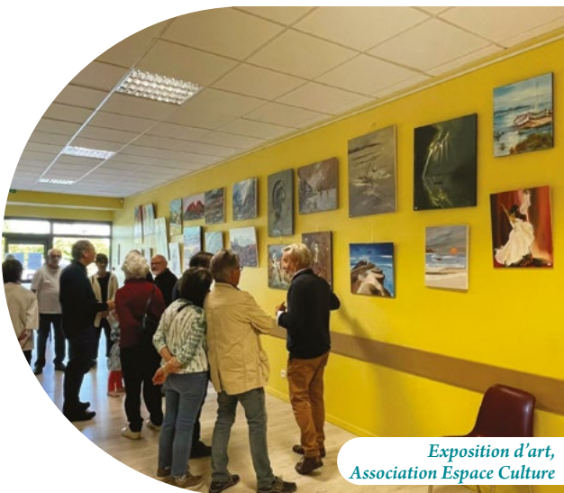
Exposition d'art, Association Espace Culture