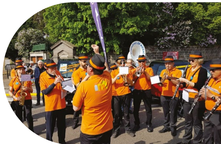
L'Harmonie de Mozac, Foire du 1 er mai

Un bal aux lampions clôturera cette soirée de fête.