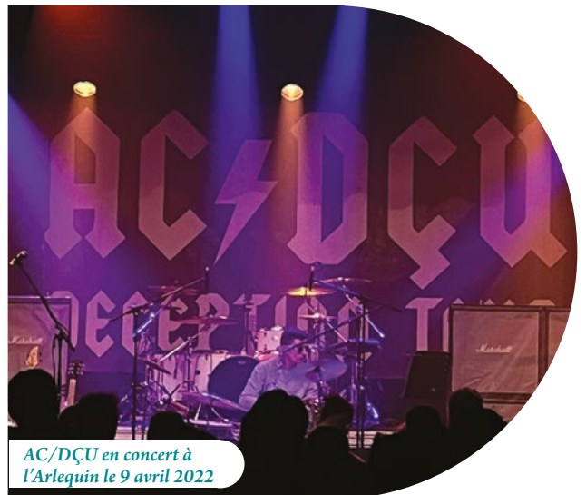
AC/DÇU en concert à l'Arlequin le 9 avril 2022