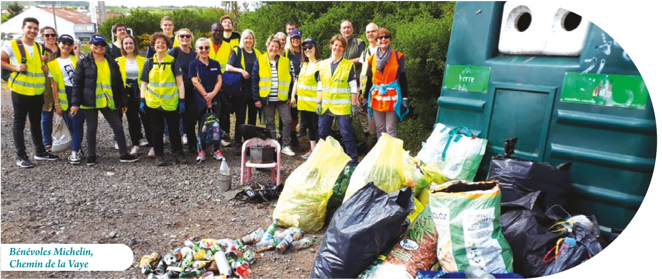
Bénévoles Michelin, Chemin de la Vaye