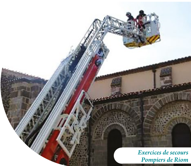
Exercices de secours Pompiers de Riom