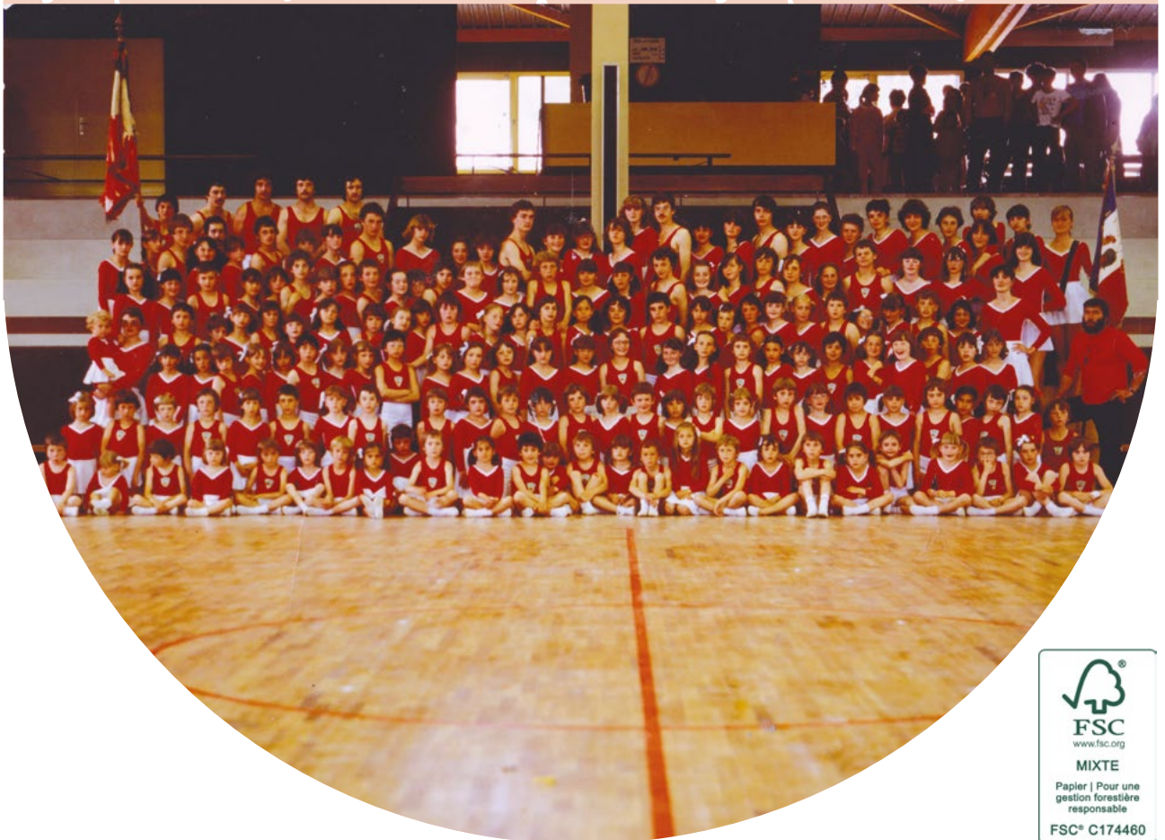
La Gauloise, 1980