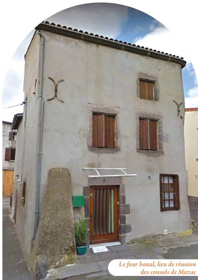
Le four banal, lieu de réunion des consuls de Mozac

Les temps apaisés voient progressivement l'abbaye donner plus de latitude aux consuls. Avec le changement de régime, à la Révolution, les premiers officiers municipaux sont les héritiers des ci-devant consuls. Ils sont connus et appréciés de la population. Ils connaissent leur commune et défendent leur clocher. Peu d'entre eux sont passés dans la lumière. Ils ont contribué à construire une identité communale. Mozac leur doit beaucoup.